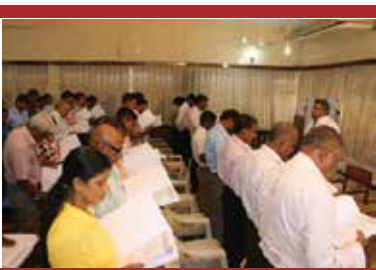
சீ.எம்.வி.ஈ அ்தனுடைய மாவட்ட, கள கண்காணிப்பாளர்களை அவர்களுடைய தேர்தல் தொகுதிகளில் சேவையில் அமர்த்துவதற்கு முன்னர் முதலாவது பயிற்சியினை 2015 ஜூலை மாதம் 12ம் திகதி கொழும்பில் நடாத்தியது. http://cmev.org/2015/07/13/first-training-program-for-field-monitors/