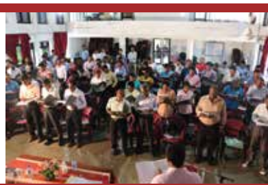
சீ.எம்.வி.ஈ தனது மாவட்ட, கள கண்காணிப்பாளர்களுக்கான அ்தனுடைய இரண்டாவது பயிற்சியினை 2015 ஜூலை மாதம் 23 மற்றும் 24ம் திகதிகளில் கொழும்பில் நடாத்தியது. http://cmev.org/2015/07/24/second-training-workshop-of-cmev/